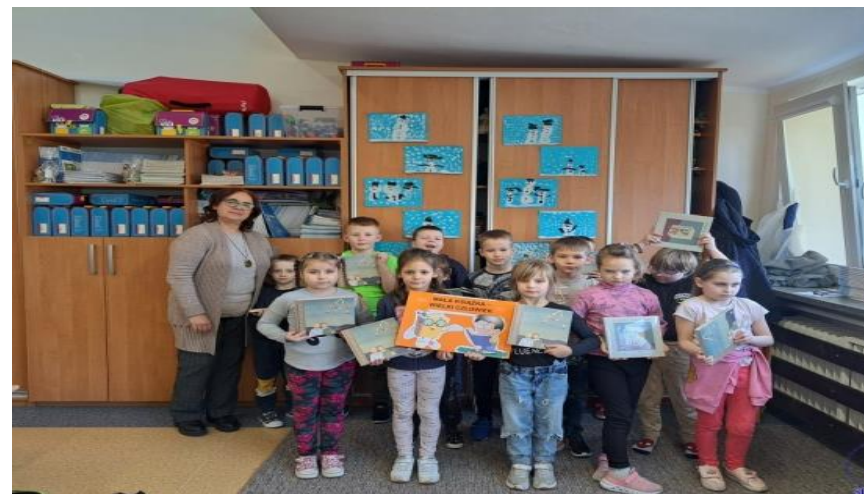
MAŁA KSIĄŻKA - WIELKI CZŁOWIEK