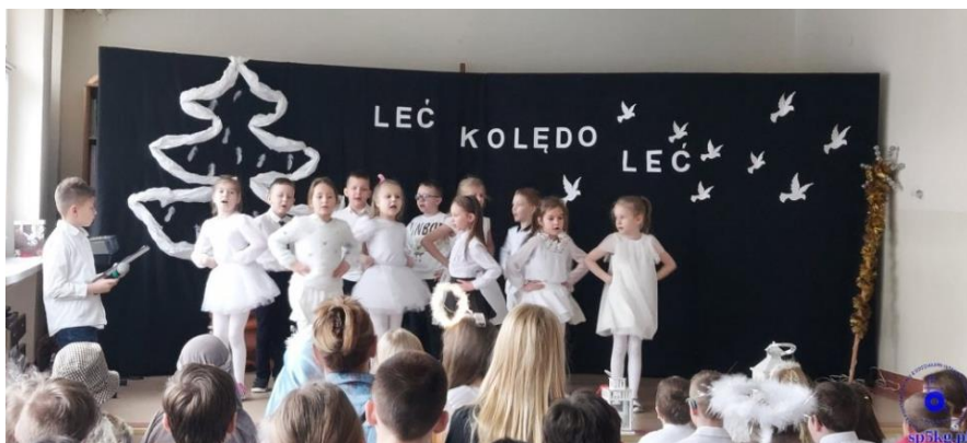
SZKOLNY PRZEGLĄD KOŁĘD I PASTORAŁEK...