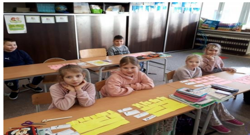
W ŚWIECIE WIELKIEJ MATEMATYKI...