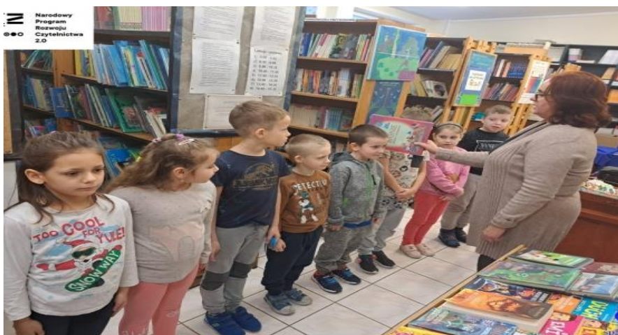
PASOWANIE UCZNIÓW KLAS PIERWSZYCH NA CZYTELNIKA